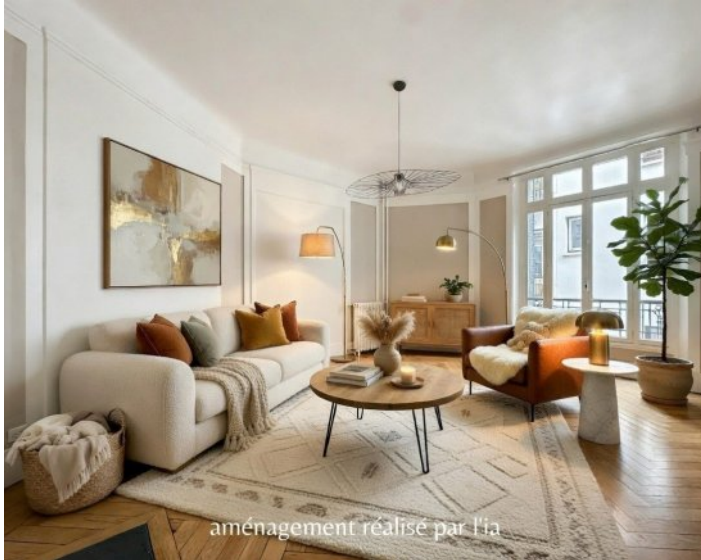
aménagement réalisé par l'a