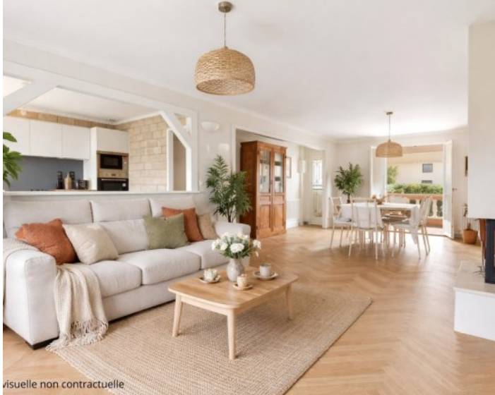
visuelle non contractuelle