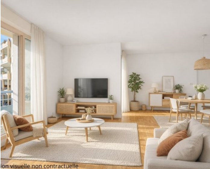
ion visuelle non contractuelle