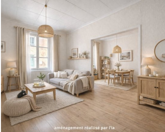
aménagement réalisé par l'ia